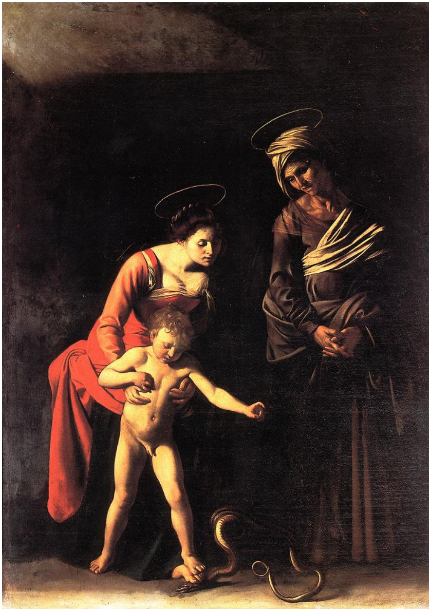
IL CARAVAGGIO (카라바조) – Madonna con serpente – 1606, Galleria Borghese, Roma