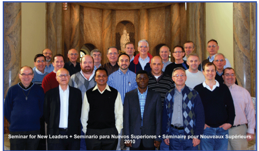
Seminar for New Leaders + Seminario para Nuevos Superiores + Séminaire pour Nouveaux Supérieurs 2010