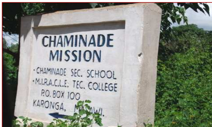
Entrée du Campus de la communauté marianiste à Karonga, Malawi.