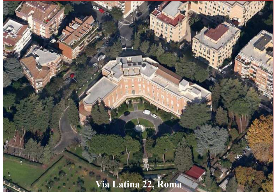
Via Latina 22, Roma

El Centro de Formación Marianista Europeo ha organizado un simposium marianista sobre la fe. El encuentro se celebrará en Roma, en la Curia General de los religiosos marianistas de Via Latina, del 23 al 25 de abril de 2014. Contará con la participación de 23 religiosos y religiosas marianistas provenientes de Suiza, Austria, Francia, España, e Italia.